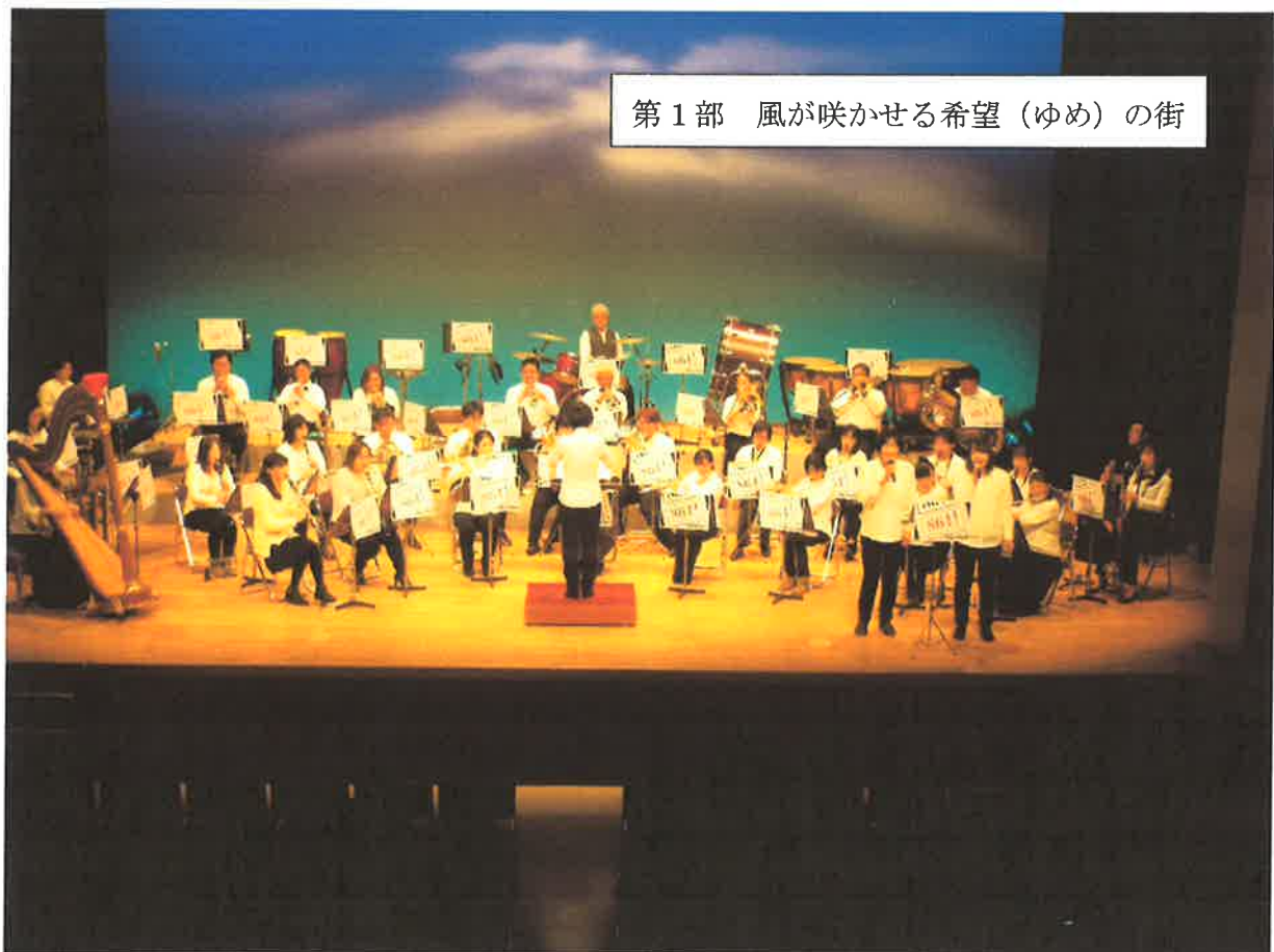
第1部 風が咲かせる希望（ゆめ）の街