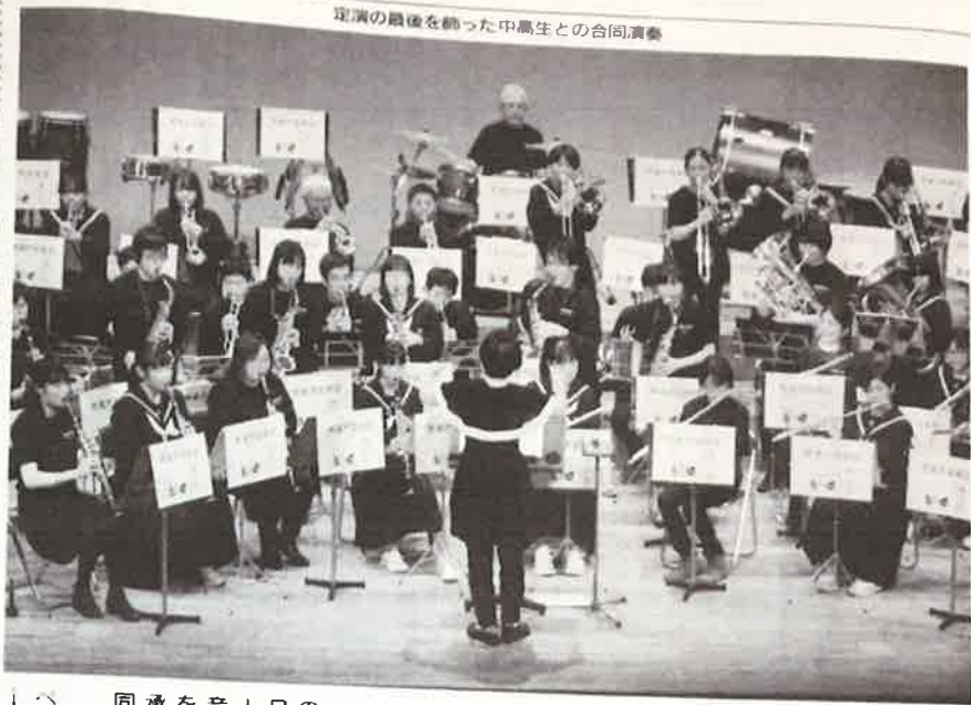
定演の最後を飾った中高生との合同演奏

市内で活動しているゴスペルグループ「AGC with kids」は、高尾高校と荒尾第四中学校の吹奏楽部も出演「レインボーステージ」クリスマスステージ「J-POP&合同ステージ」の3部構成のプログラムを組んだ。オープニングは同市のイメージソング「風が吹かせ