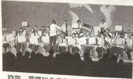
昨年、荒尾総合文化センターであった 荒尾市民楽団864の定期演奏会