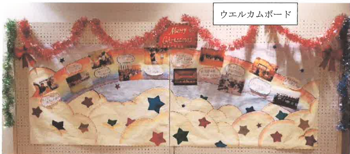
ウエルカムボード