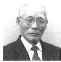
熊本市北区植木町文化協会