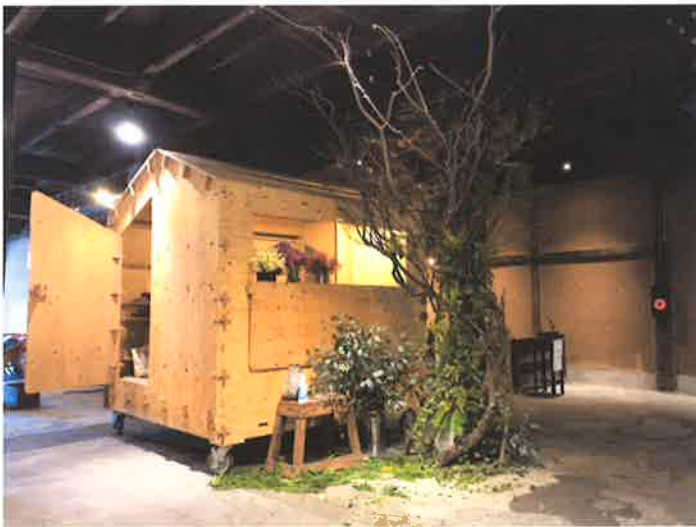
Before 初日開場前の様子