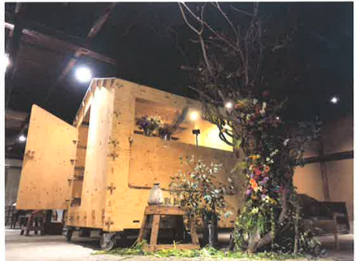
after 二日目 閉幕時の様子