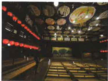
▲天井を飾っているのは、明治時代の広告。修繕しながらも当時の雰囲気そのまま残している