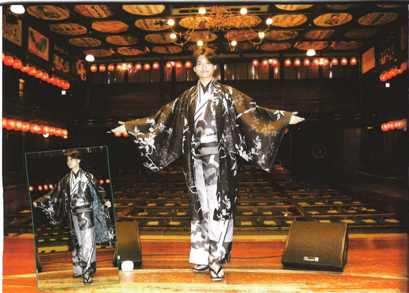
▲「八千代座でのコンサート、是非また出演したいです」