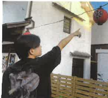
▲八千代座近辺も風情がある街並み。提灯を見て「あ！ち、が8つで真ん中にヨ、……八千代！」