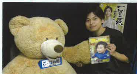
▲9月8日、東京・CDショップ五番街にて弊誌の表紙号と新曲「一里塚」合同ネットサイン会を開催。台風接近中ではあったものの、五番街の公式YouTubeにて和やかなトークとともに約2時間に亘って繰り広げた