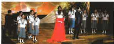
▲幕開けに清らかな歌声を聴かせてくれた山鹿中学校合唱部の皆さんも、最後に勢ぞろい