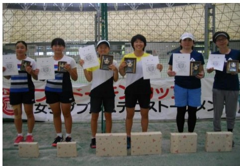
オープンクラス入賞者