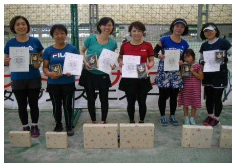
ビギナークラス入賞者